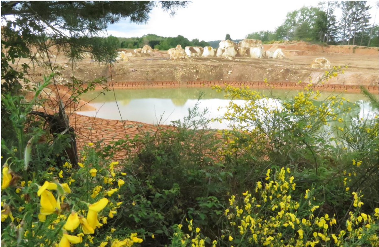
L'exploitation a laissé des monticules de Karst