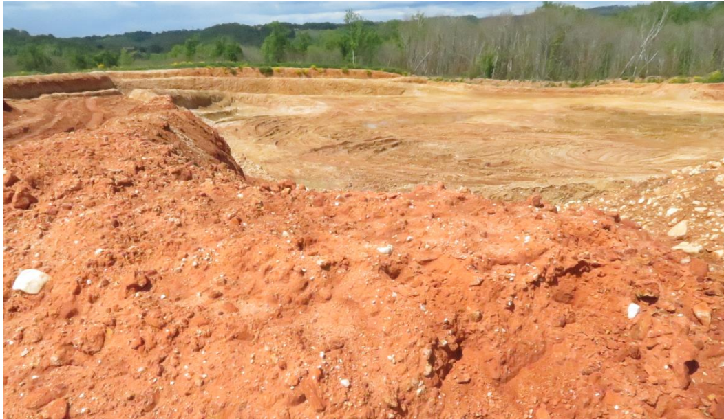
Les terrains rouges, trace d'une terre sidérolithique

Dans l'exploitation on peut observer des pierres contenant du quartz